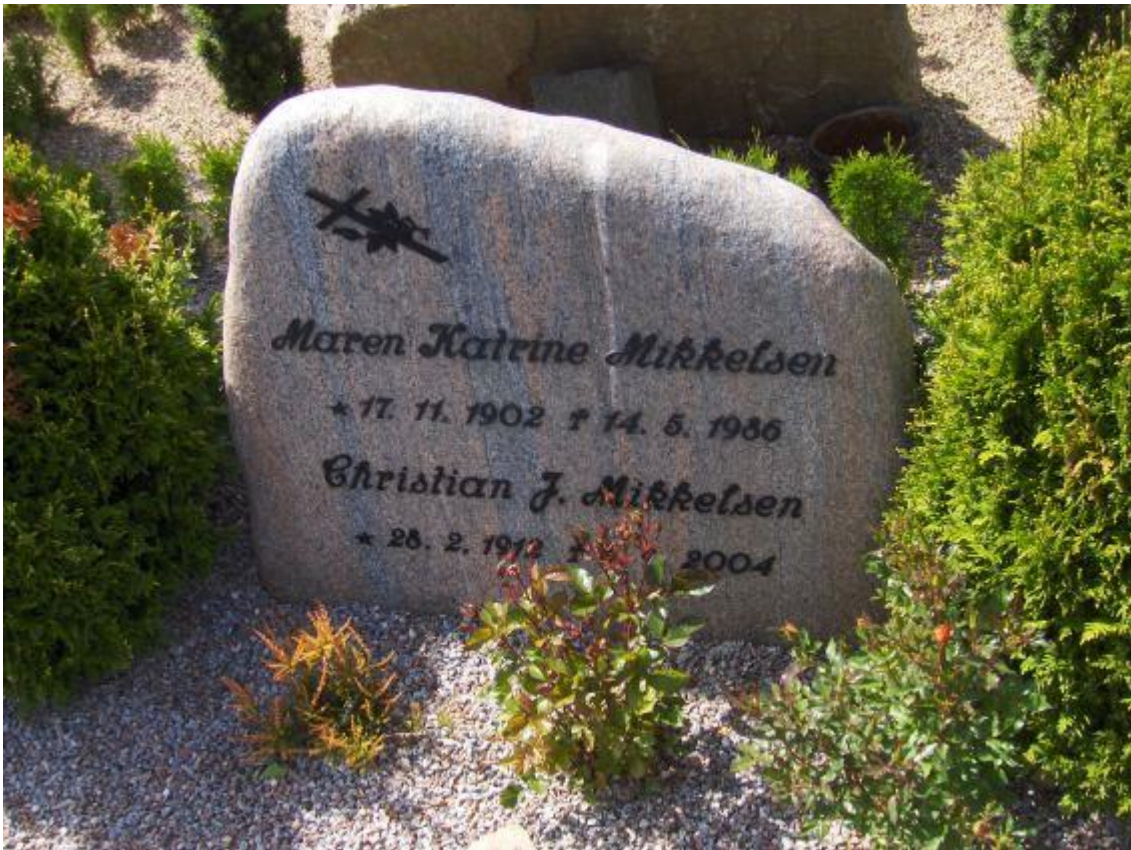
Gravsten i Hurup